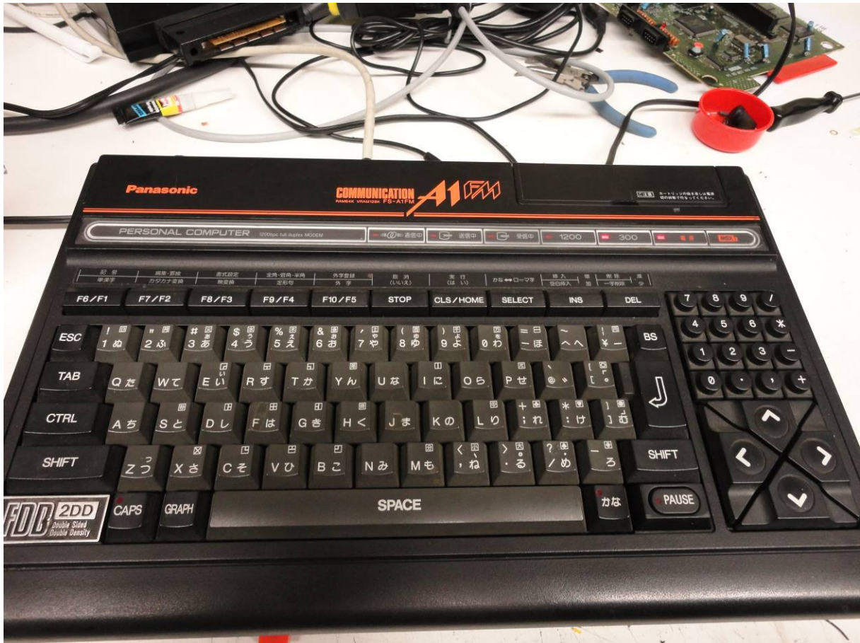
De Panasonic FS-A1FM, voorzien van een dubbelzijdige diskdrive